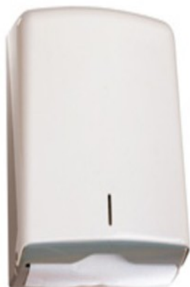
Paquete toallitas en zig-zag.